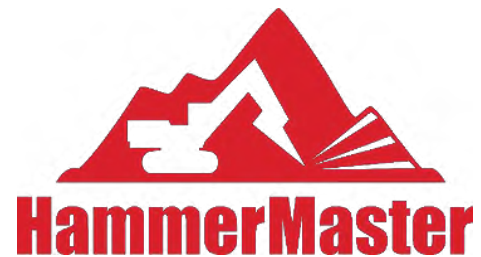
Дробильный ковш HammerMaster